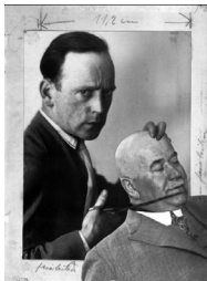
John Heartfield, Selbstporträt mit dem Polizeichef Zörgiebel, 1929